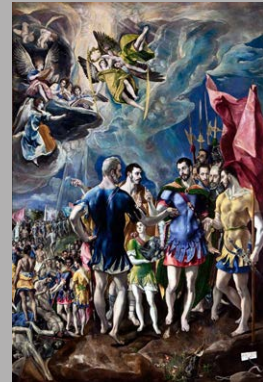
El Greco – Martyrium des Heiligen Mauritius